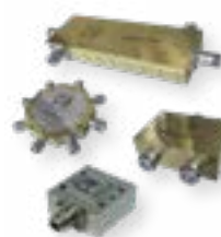
Microwave and RF product