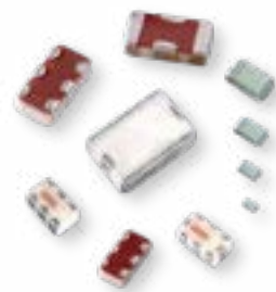
Integrated passive components