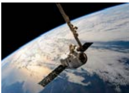
Luft und Raumfahrt