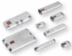
RF Antennas (Dual, & Triple Bands)

Unsere Produktpalette umfasst ein breit gefächertes Sortiment hochwertiger elektronischer Bauelemente. Dazu gehören Chipkondensatoren, Quarze und Oszillatoren, Widerstände, Keramikkondensatoren, Leuchtdioden (LEDs) und Optoelektronik. Darüber hinaus bieten wir viele weitere Produkte an, die in den Bereichen Industrie, Automobiltechnik, Medizintechnik und anderen anspruchsvollen Anwendungen Verwendung finden.