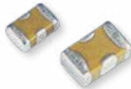
EMI Filters X2Y